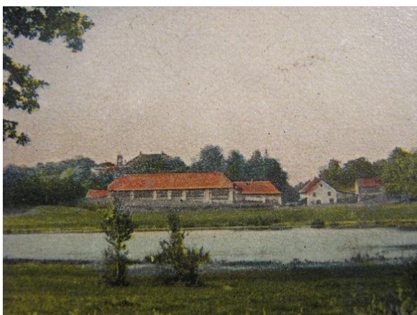
Joonis 1. Luutsniku mõisahoone