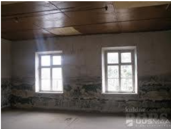
Joonis 6. Mõisa siseruum praegu