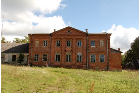
Joonis 5. Luutsniku mõisamaja praegu

Luutsniku küla kunagine keskpunkt, paljude mälestustes säilinud armsa koolimaja ja rahvamajana, seisab praegu tühjalt ja lihtsalt laguneb (Loog, 2003). Tänapäevaks on hoone eraomandis (vt Joonised 5 ja 6).